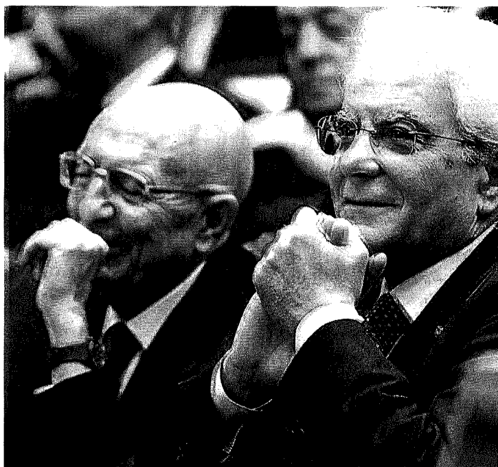
GIURISTI il presidente Sergio Mattarella con Sabino Cassese

«Uno «schema» perfettamente corrispondente sia alle priorità istituzionali (un tentativo affidato prima alla seconda carica dello Stato, poi alla terza, dopo le consultazioni presidenziali dirette), sia alle esigenze della politica (il presidente del Senato fa parte della destra, quello della Camera del M5S), sia ai precedenti. Ho curato, insieme